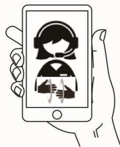
※ マナーモードを解除する スマホ+手話通訳